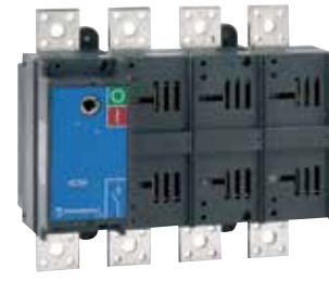
VC5P 4x800 A